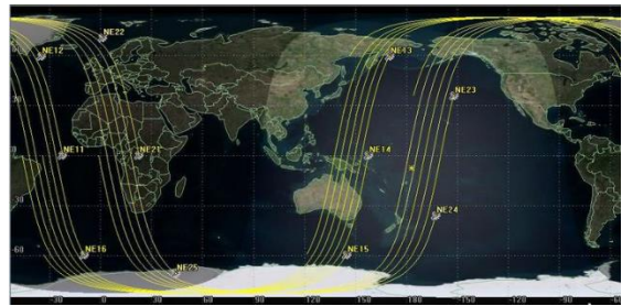
도표 4. 초소형 위성군집시스템 지상 궤적