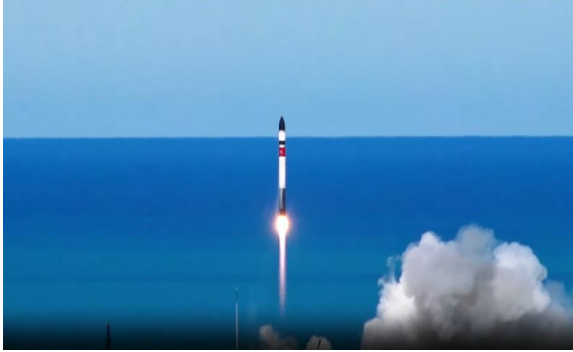
도표 1. 초소형 군집위성을 탑재한 일렉트론