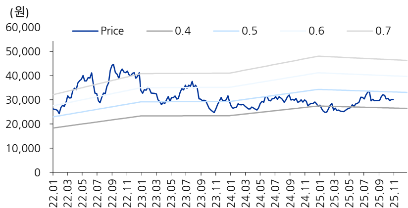
도표 3. PBR Band chart